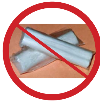
Tiza china/tiza para cucarachas