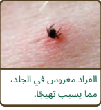
القراد مغروس في الجلد، مما يسبب تهيجًا.

يُصاب معظم سكان NYC المصابين بالأمراض المنقولة بالقراد بالعدوى عندما يكونون في المناطق التي تكون فيها الأمراض أكثر شيوعًا، ويشمل ذلك شمال ولاية نيويورك وجزيرة Long Island ونيوجيرسي والولايات الشمالية الشرقية الأخرى. وقد يُصاب أيضًا الأشخاص بالعدوى من القراد في Staten Island وأجزاء معينة من Bronx.