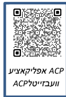
ACP אפליקאציע וועבזייטל ACP

מאנטאג – פרייטאג, צווישן 8 צופרי און 6 נאכמיטאג (אויסער חגאות און וויקענדס)