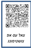
צאל עס אפ צושטימונג

איר קענט באקומען א קאפיע פון די צאל עס אפ צושטימונג און עס אריינגעבן ווי פאלגנד: