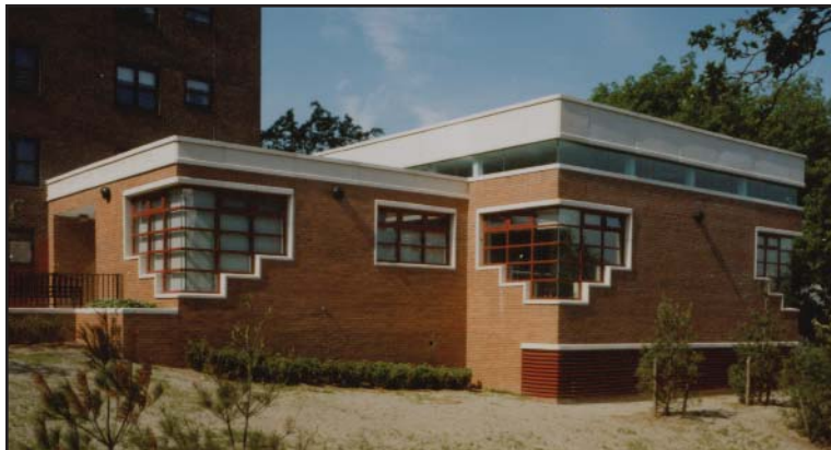
El centro comunitario "St. Mary's Park" en el "South Bronx".