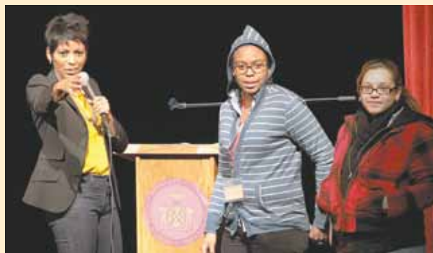
La presentadora Tamron Hall (a la izquierda), ancla de MSNBC le pidió a varios adolescentes de NYCHA a unirse a ella en la tarima al dirigirse al público durante la 10a Conferencia anual sobre violencia doméstica y Feria de Recursos el 29 de octubre.