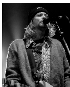
Nirvana 乐队的 Kurt Cobain

为了响应限制性的全市《青少年舞蹈条例》(Teen Dance Ordinance) — 禁止 21 岁以下孩童参加现场音乐表演 — 一群学生成立了 Vera Project，于 2001 年初在一个小型舞台举办了首场全年龄段音乐会，并迅速成为西雅图音乐界的一个知名机构。然后，9/11 灾难发生了。