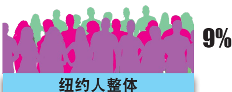
图表基于 2016 年纽约市社区健康调查数据。