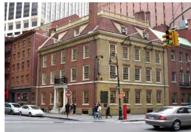
Fraunces Tavern (Taberna Fraunces), en 54 Pearl Street.

¿Utiliza el ferry? Quizá desee dar un paseo antes de subirse. En 2017, la ciudad de Nueva York lanzó su propio servicio de ferry, NYC Ferry, operado por Hornblower Cruises. NYC Ferry cuenta con seis líneas, 21 terminales y 23 embarcaciones. Es posible que el área de mayor actividad de los ferry sea un terreno que está a menos de un cuarto de milla del Pier 11 (Muelle 11) , la terminal de mayor actividad del NYC Ferry, y de la Whitehall Terminal, donde llega el ferry de Staten Island. La mejor manera de recorrer el área es a pie.