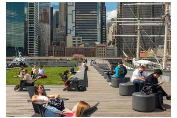
Área para los amantes del sol en el Pier 15 (Muelle 15).

Finalice su paseo en Battery Park . Ubicado al lado de la Whitehall Terminal, el parque es una parada conveniente para las personas que esperan el ferry a Staten Island. Las personas aficionadas a la historia pueden visitar el Clinton Castle (Castillo Clinton) que fue terminado antes de la guerra de 1812. También encontrará el carrusel SeaGlass Carousel para los más jóvenes, 195,000 pies cuadrados de jardines perennes para los amantes de la jardinería y céspedes amplios para los que disfrutaban de los picnics. Descanse en el pasto, ¡pero asegúrese de no perder el ferry!