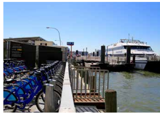
Puede tomar el Ferry NYC en el Pier 11 (Muelle 11).