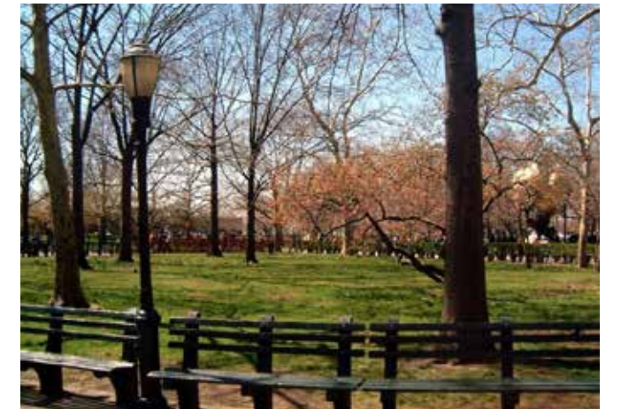
Un atractivo jardín en Battery Park.